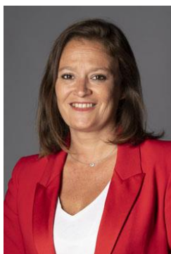
Olivia Grégoire Ministre déléguée chargée des Petites et Moyennes Entreprises, du Commerce, de l'Artisanat et du Tourisme

Le numérique sera essentiel pour optimiser l'utilisation des ressources, réduire notre empreinte carbone et développer des solutions innovantes pour les défis environnementaux auxquels nous sommes confrontés. Nous avons un rôle crucial à jouer dans la transition écologique. Bercy a pleinement pris sa part en contribuant à faire adopter une feuille de route ambitieuse de décarbonation du secteur, je veillerai à sa mise en œuvre. »