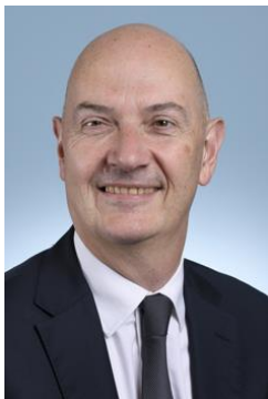
Roland Lescure Ministre délégué chargé de l'Industrie

L'exemplarité. Notre ministère sera irréprochable dans la transformation de son organisation et dans la baisse de son empreinte écologique. Ce dossier de presse vise à illustrer avec quelques exemples concrets l'implication de Bercy pour la transition écologique.