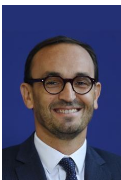
Thomas Cazenave Ministre délégué chargé des Comptes publics

Nous devons embarquer l'ensemble des entreprises dans le processus de transition écologique et énergétique. Pour atteindre les objectifs environnementaux de la France, 4 millions de PME doivent engager leurs transitions. Nous devons les y aider par des règles claires, ainsi que des dispositifs lisibles et adaptés : tout Bercy est mobilisé dans cet objectif.