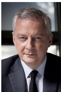
Bruno Le Maire Ministre de l'Économie, des Finances et de la Souveraineté industrielle et numérique

La transition écologique n'est pas un choix politique, c'est une obligation humaine pour garder notre terre habitable.