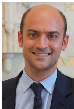
Jean-Noël Barrot Ministre délégué chargé du Numérique

Le numérique sera essentiel pour optimiser l'utilisation des ressources, réduire notre empreinte carbone et développer des solutions innovantes pour les défis environnementaux auxquels nous sommes confrontés. Nous avons un rôle crucial à jouer dans la transition écologique. Bercy a pleinement pris sa part en contribuant à faire adopter une feuille de route ambitieuse de décarbonation du secteur, je veillerai à sa mise en œuvre. »